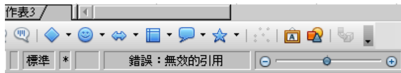
圖 2: 錯誤訊息顯示於狀態列上

當儲存格顯示#REF 錯誤代碼(如圖 1)時，其狀態列將如圖 2 所示，秀出錯誤訊息。對於錯誤的描述，狀態列比儲存格詳細，但訊息仍有可能不夠作判斷，因此可由下表，或線上幫助中 Error Codes in OpenOffice.org Calc 章節找到更多相關資訊。